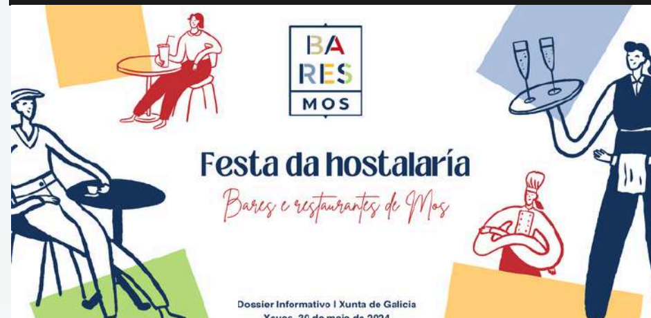
Cartel festa da hostalaría | BaresMos2024