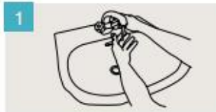
Mójese las manos.

DURACIÓN DEL LAVADO: entre 40/60 segundos