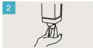
Aplique suficiente jabón para cubrir todas las superficies de las manos.