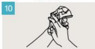
Séquese las con una toalla de un solo uso.