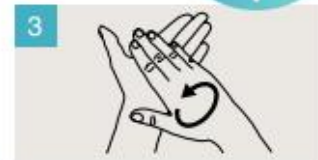
Frótese las palmas de las manos entre sí.